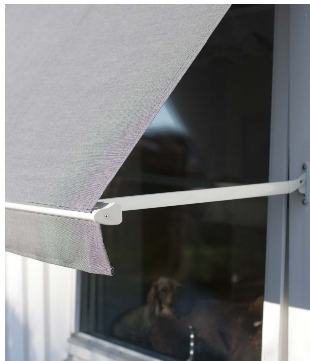
Markiisi suoralla reunuksella