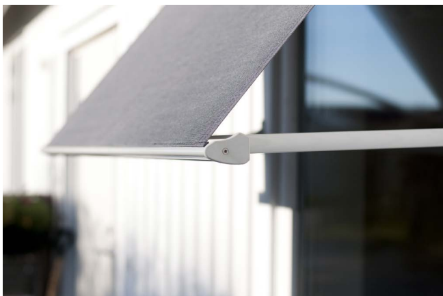
Markiisi ilman reunusta